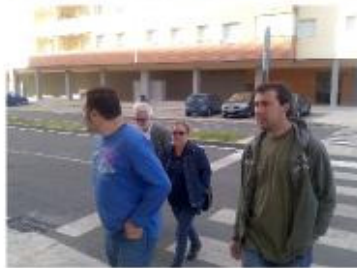
Los Concejales de IU visitan "El Junquillo" y "La Mejostilla"

140000 personas en nuestra región que se ven desamparadas por el Gobierno del Sr. Monago