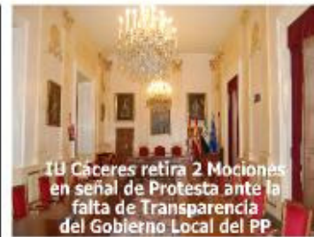
IU Cáceres retira 2 Mociónes en señal de Protesta ante la falta de Transparencia del Gobierno Local del PP